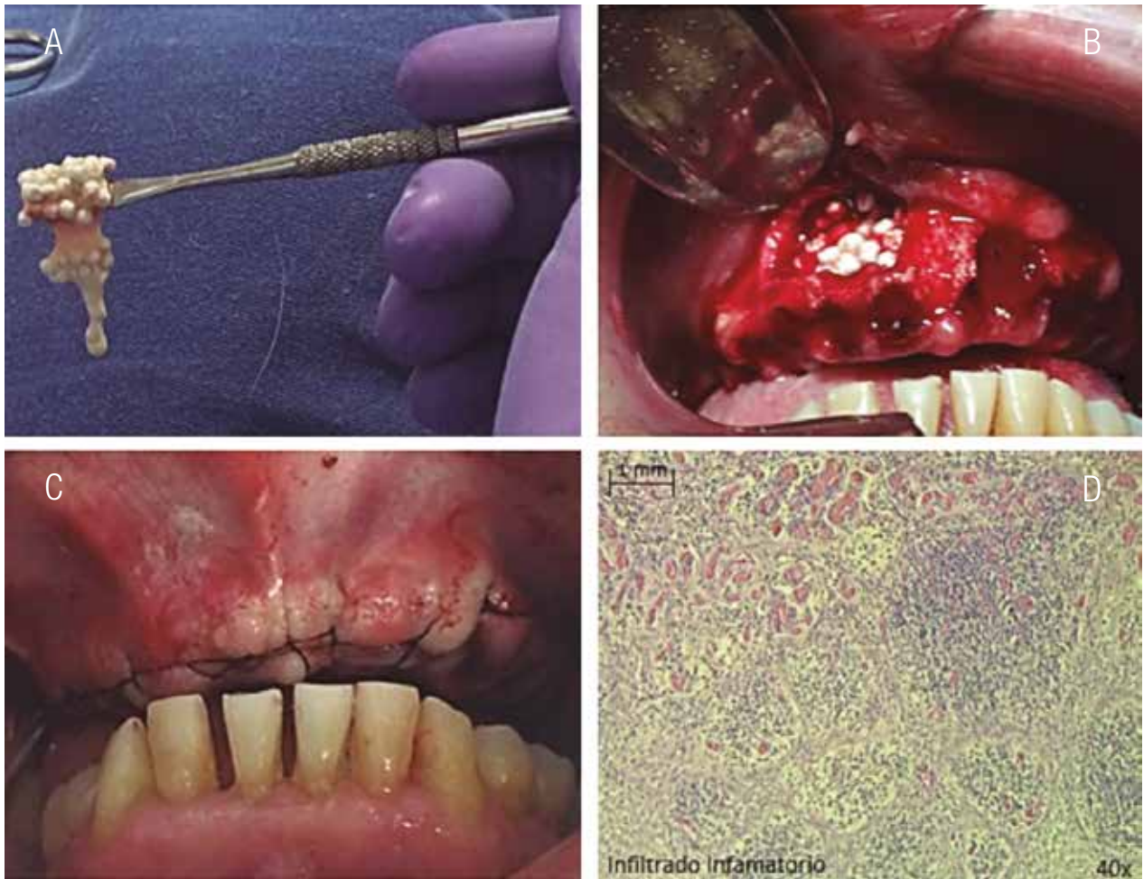
Figura 3. A. Sulfato de Calcio mezclado con plasma rico en factores de crecimiento. B. Colocación del sustituto óseo en el lecho de la lesión. C. Sutura continua realizada para reposicionar el colgajo. D. Epitelio escamoso estratificado con edema intercelular y alta vascularización.