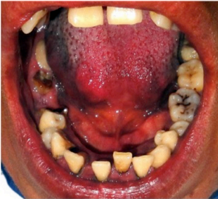
Figura 2. Patologías en cavidad oral de un individuo de Mensabak.