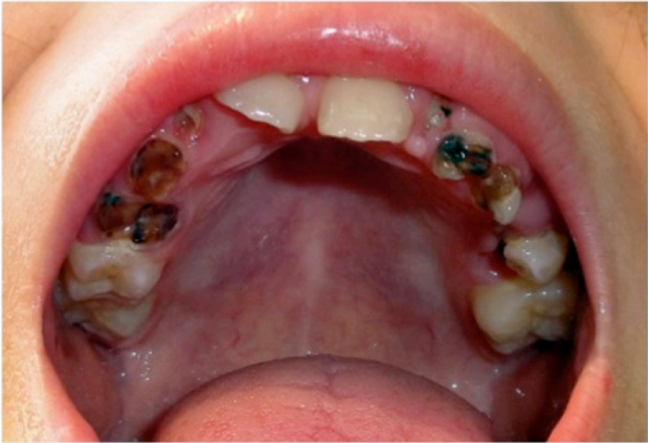
Figura 3. Caries en arcada superior en un niño de Mensabak.

Yalsihón resultó ser la comunidad menos lesionada en cuanto a las patologías orales. Al parecer la alimentación tradicional y los buenos cuidados de salud oral son la mejor combinación para mantener la salud bucal, ya que en esa pequeña comunidad existe un centro de salud donde acuden con regularidad los habitantes del sitio y son referidos a una comunidad cercana para atención dental. Además, las tortillas al ser procesadas con cal pueden limitar la proliferación de las caries. Ellos consumen muchos cítricos, los cuales cultivan en sus hogares y su acción astringente también pudiera estar favoreciendo su salud.